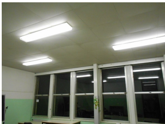
Figura 2.2 - Particolare dei serramenti