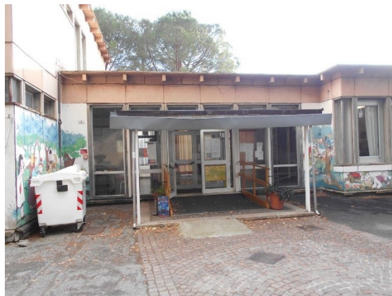
Figura 1.1 - Particolare della facciata principale

L'involucro edilizio opaco che costituisce l'edificio è composto da una muratura costituita prevalentemente da un pannelli prefabbricati in calcestruzzo e mattoni forati. La copertura dell'edificio è piana, costituita da blocchi di laterizio più calcestruzzo e materiale impermeabile.