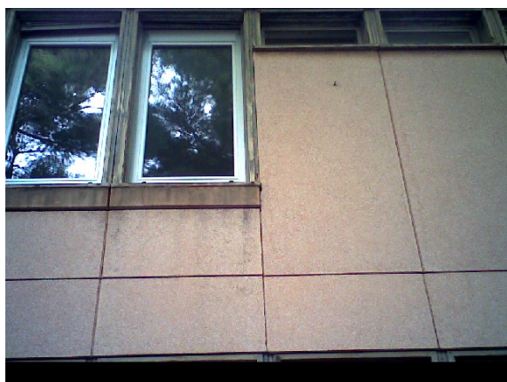
Figura 1.2 – Rilievo termografico della parete