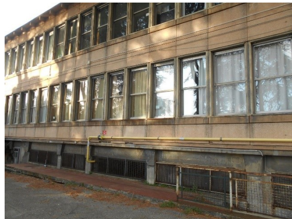
Figura 2.1 - Particolare dei serramenti